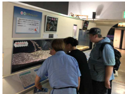
(写真上・水族館での様子) (写真右・観潮荘で乾杯) (写真下・海をバックに記念撮影)

バスの旅、最初の目的地は観音埼灯台。開国の時一番最初に建設された洋式灯台として日本の灯台50選に指定されています。登れば房総半島を一望できます。