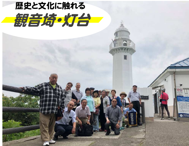
(写真左・灯台前で記念撮影)

駐車場から灯台までの道のりは、海沿いの景色を眺め、心地よい潮風に吹かれながらの散策。最後にちよつと急な階段がありました。最後が、みんなで励まし合いながら登りました。食事前の良い運動になりました。