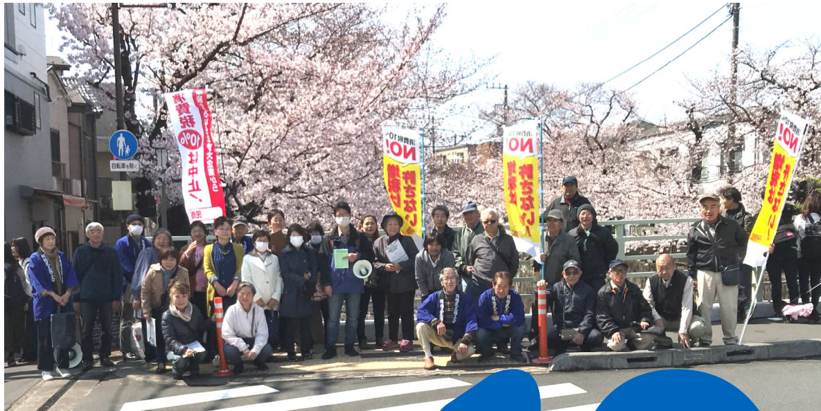
写真・桜の前で記念撮影

当日は、晴天に恵まれ、石神井川沿いの桜も満開。多くの花見客で賑わうなか、中根橋から板橋駅にかけて署名を集めながら、増税ストップを訴えました。買い物をしてきた70代の女性は「ただでさえ少ない年金がまた減らされる。この状況で増税されたら生活できない。」と怒りを込めて署名に応じてくれました。1時間程度の行動で署名148筆、チラシ・ティッシュ800枚配布と大きな成果でした。